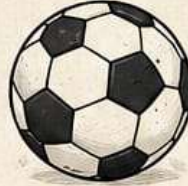
KESİK İKOSAEDRON (FUTBOL TOPU ŞEKLİ)