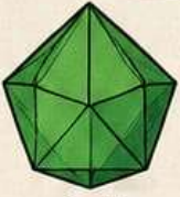
DÜZGÜN İKOSAEDRON (20 yüzlü)